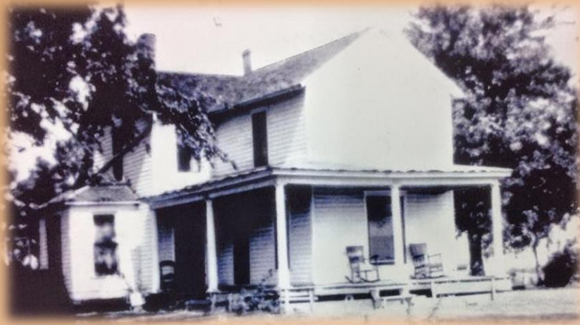
Дом Дейла Карнеги, когда он учился в колледже в Уорренсбурге, штат Миссури

Несмотря на бедственное положение семьи, родители решили, что сыновья должны получить достойное образование. Дейл стал студентом педагогического колледжа, где обучение было бесплатным, и параллельно с этим продолжал развивать свое ораторское мастерство. Спустя некоторое