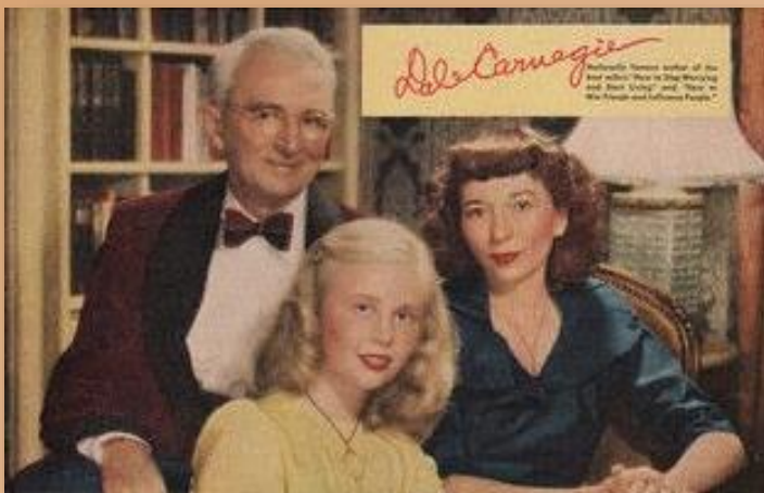
Дейл Карнеги с семьей